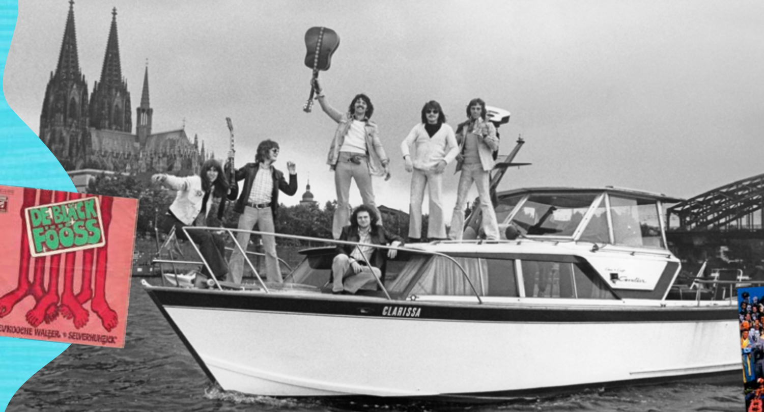
Volldampf voraus! Die Bläck Fööss 1973

Seit über fünf Jahrzehnten begeistern die Bläck Fööss in unterschiedlicher Besetzung die Menschen mit einfühlsamen, kritischen Texten und einer beeindruckenden Stilvielfalt. Ihre Lieder porträtieren liebevoll das Kölner Milieu und die Veedel der Stadt, ohne dabei das Weltgeschehen aus den Augen zu verlieren.