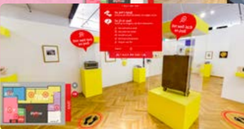
Der 360-Grad-Rundgang