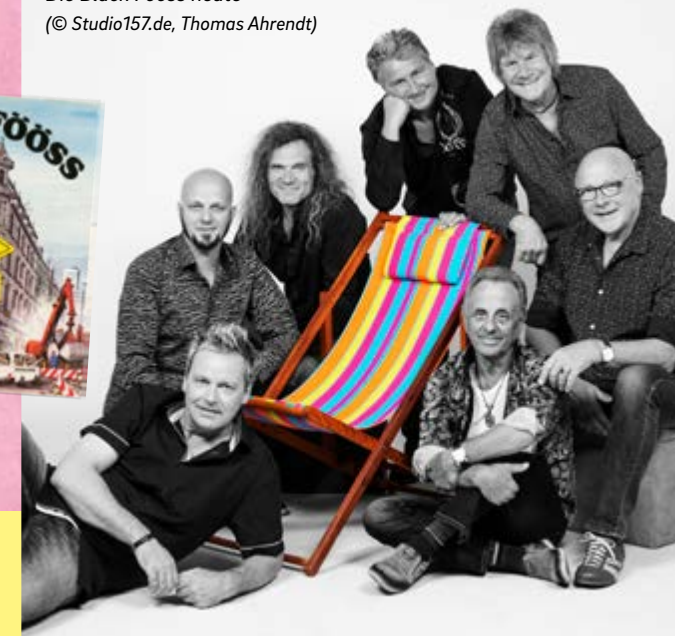
Die Bläck Fööss heute

Für Kinder und Erwachsene gibt es zudem die kostenlose App „Helft den Bläck Fööss!“.