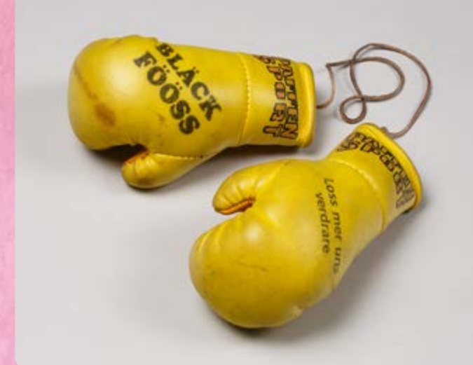
Merchandising-Artikel zum Album „Loss mer uns verdrare“

Mit zahlreichen Video- und Hörstationen, witzigen Kulissen und einer Mitsing-Box erwarten die Besucher*innen viele Überraschungen.